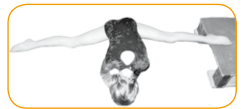
Foto 5: Split met gestrekte benen, op verhoging.