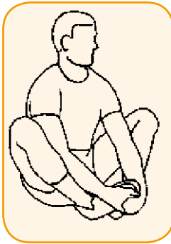
Illustratie 5: Kleermakerzit.

In deze positie rek je de spieren die aan de binnenkant van je bovenbenen lopen. Pak met je handen je enkels vast. Om de rek te intensiveren kun je met je ellebogen je knieën naar buiten duwen.