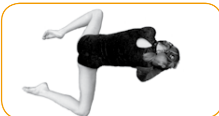
Foto 6b: Kikkertje: met gebogen knieën in buiklig.