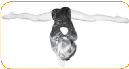
Foto 4: Split met gestrekte benen, voorwaarts.