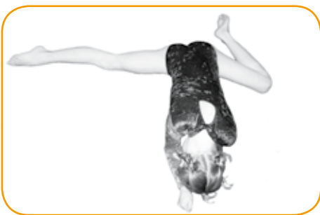
Foto 3: Split met een been gebogen, voorwaarts.