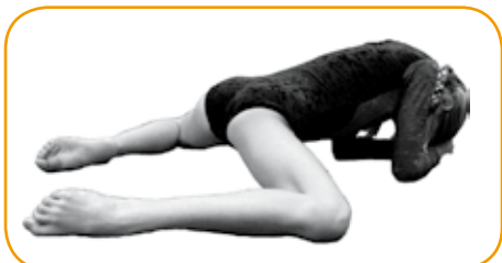
Foto 6a: Kikkertje: met gebogen knieën in buiklig.