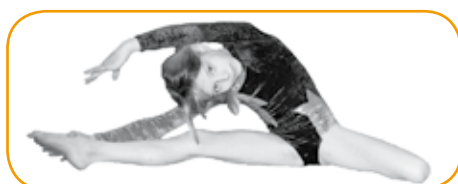
Foto 1: Spreidzit met een been gebogen, zijwaarts.