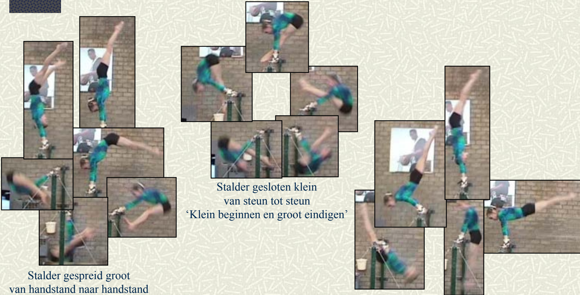
Stalder gespreid groot van handstand naar handstand

zwaaien – kip – zolendraai – slinger/ temposlinger – stalder gespreid/gesloten – losom – zolendraai handstand